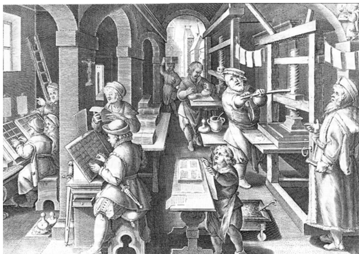
J. Vimfelingas liudija: „1440 m. [...] Johanas Gutenbergas iš Strasburgo išrado naują rašto būdą [...].“